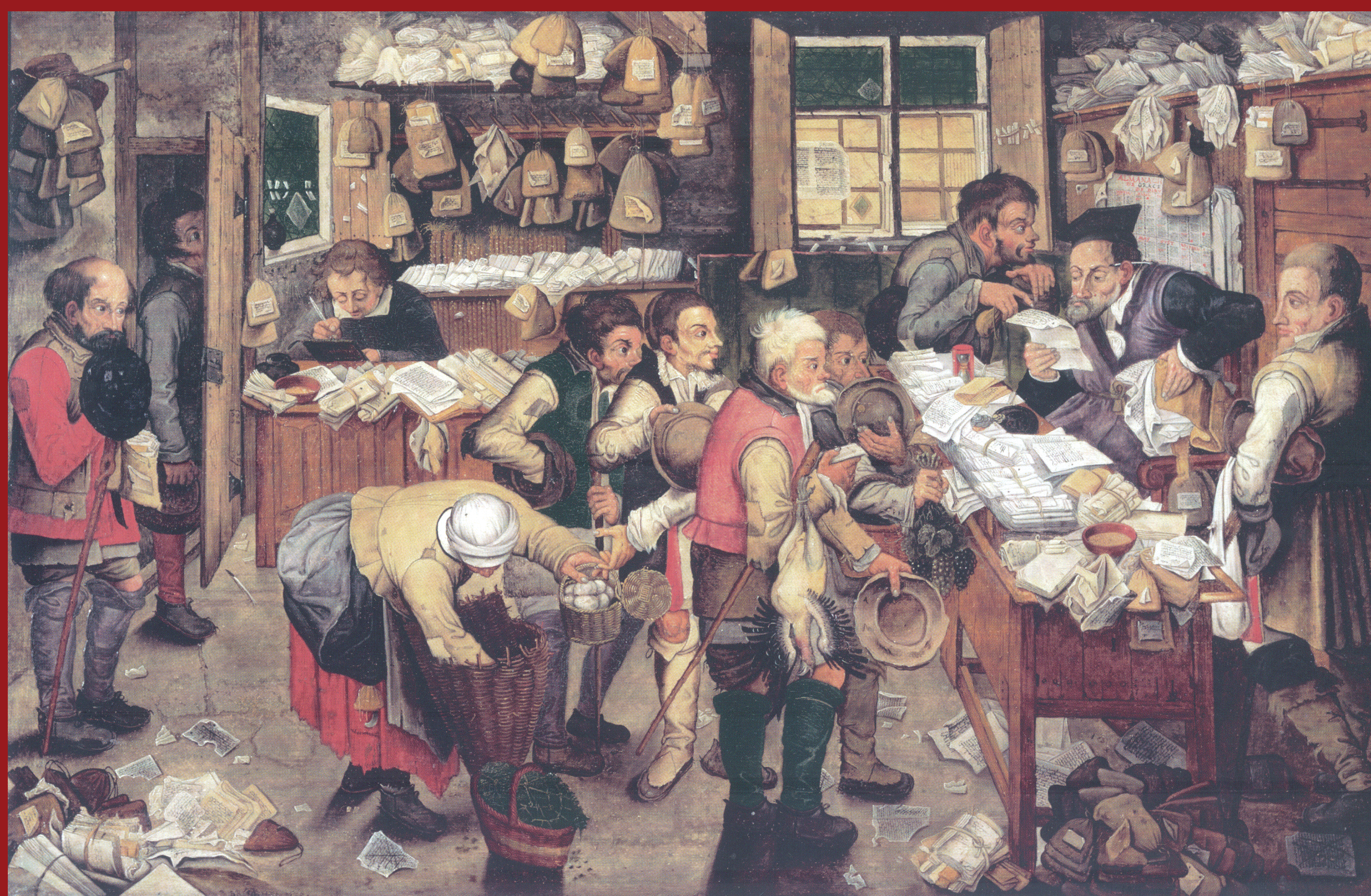
Pieter Brueghel o Jovem, O cobrador de impostos , Museu de Bruges

Nesta pintura do Século XVII, de um dos filhos do grande pintor flamengo Pieter Brueghel, vemos o escritório de um cobrador de impostos a receber os tributos de alguns camponeses, em géneros (ovos, criação, caça, fruta, etc.). O interesse do quadro, que teve muito impacto, pois existem diversas versões, vem do lado documental e vivo da cena, mas também da crítica social, seja em relação à condição dos camponeses, seja em relação ao aspecto negligente do escritório, com os papéis espalhados pelo chão.