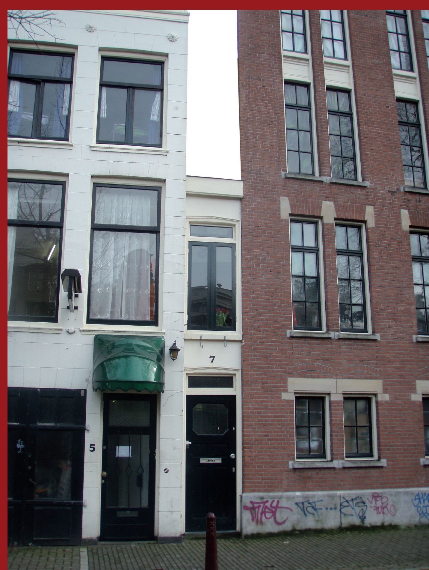
Amesterdão – fachada de casa de habitação

Um dos mais curiosos exemplos históricos de influência visível da tributação, neste caso na arquitectura, tem a ver com a criação, que se verificou em vários países, de impostos sobre a largura das casas ou o número de janelas, conhecido por imposto sobre as janelas, o que fez com que muitos proprietários fizessem a fachada o mais estreita possível. Amesterdão, na Holanda, é um dos exemplos mais famosos, ainda persistindo várias casas como a apresentada na fotografia.